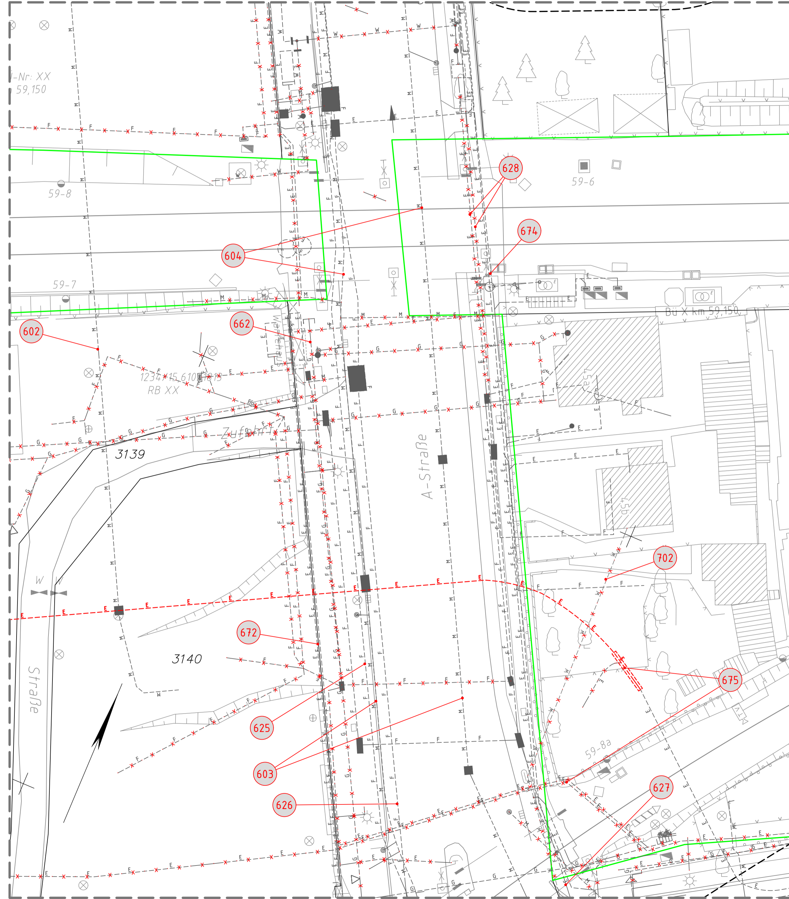
Detail 1 M 1:250