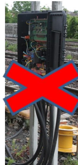
Lineside Electronic Unit (LEU)